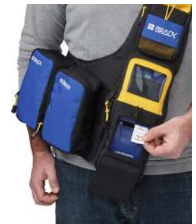
Maletín de transporte